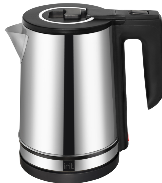
Electric kettle Чайник электрический